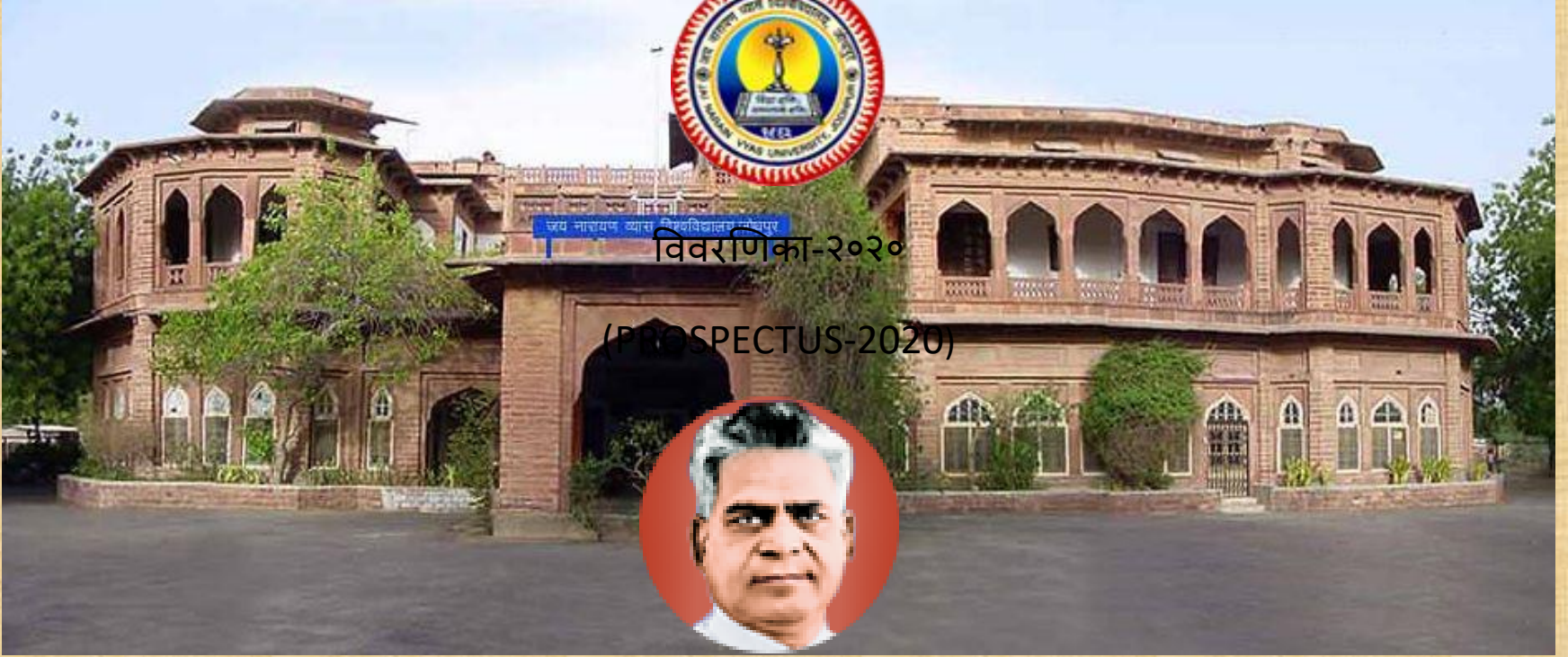
Late Shri Jai Narain Vyas